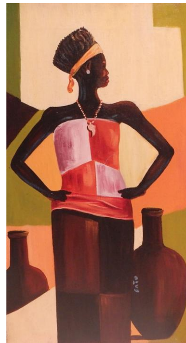
Dorfschönheit 2 und ...