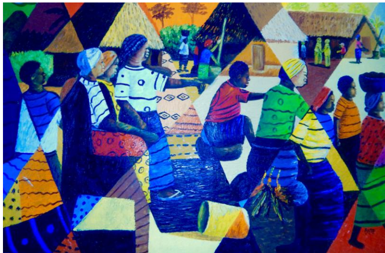
Fest in Toe's Town, Fato Wheremongar 2015

Begegnen Sie Westafrika auf eine besondere Weise. Erleben Sie Fato, seine Träume und seine Hoffnungen. Genießen Sie liberianisches Flair mit Musik und einem Glas „Wiesbadener Palmwein“ und kleinen Köstlichkeiten. Sie erhalten Informationen zum Hintergrund seines Schaffens und Wirkens mit globalem Anspruch.